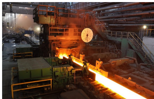
↑ Sekcja wykańczająca w walcierce do walcowania na gorąco