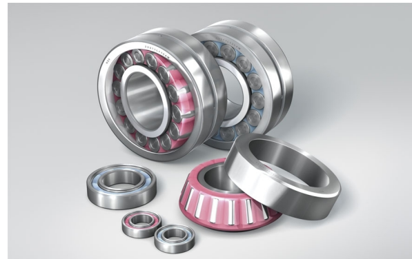
↑ Łożyska kulkowe poprzeczne Molded-Oil