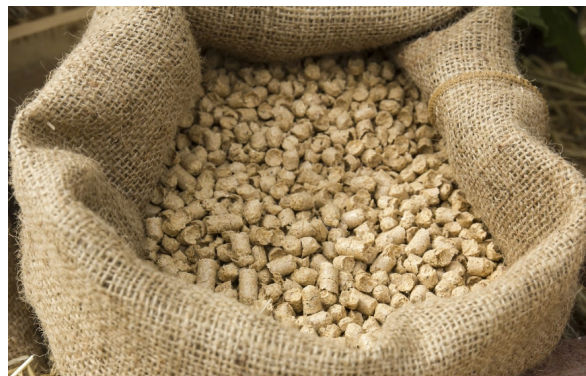
↑ Karma dla zwierząt