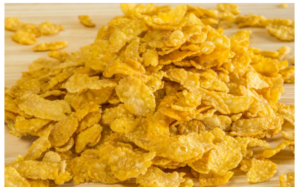
↑ Produkcja płatków śniadaniowych