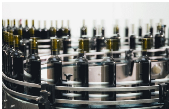
↑ Zakład produkcji napojów bezalkoholowych i gazowanych