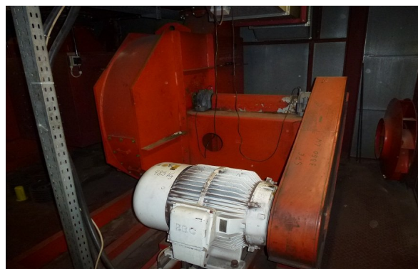
↑ Wentylacja wyciągowa