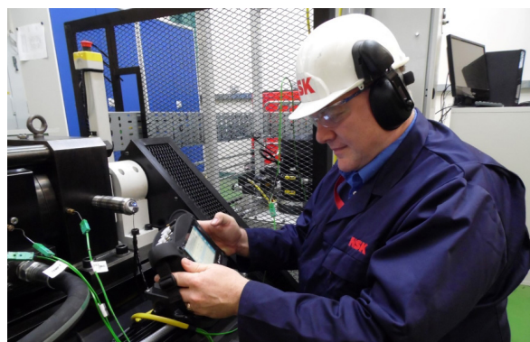
↑ Monitorowanie Warunków Pracy (CMS)