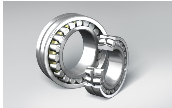
↑ Łożyska baryłkowe NSKHPS