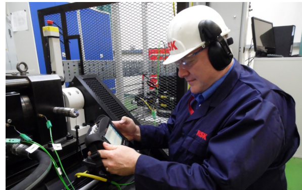
↑ Monitorowanie Warunków Pracy (CMS)